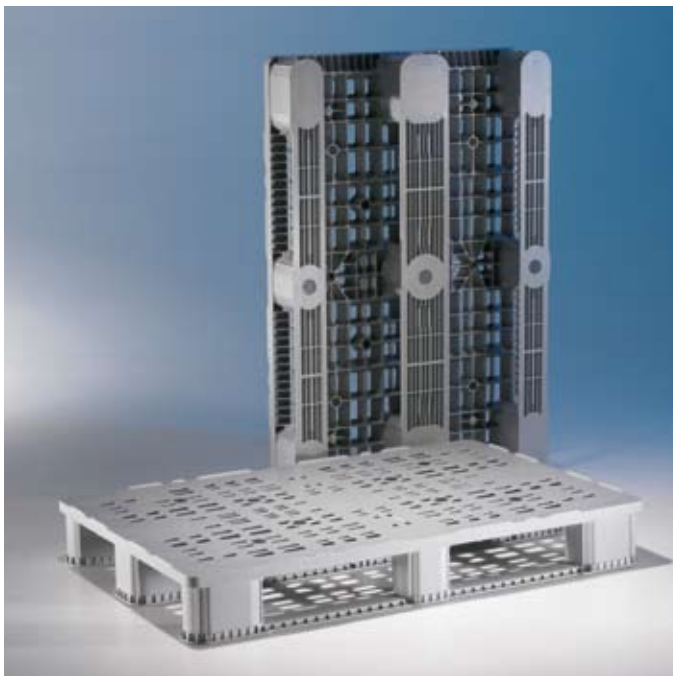
Afgeronde perimetrische stootrand herleidt de kans op beschadiging tot een absoluut minimum.

De pallet is geproduceerd met de “gasassist” technologie, waardoor de pallet door middel van interne gaskanalen extra stevigheid krijgt. Vooral voor toepassingen in pallet-stellingen is dit een pluspunt.