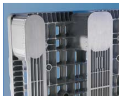
Massieve sleeplatten, dubbelwandige klossen en doordacht design maken deze pallet enorm robuust en garanderen een lange levensduur, zelfs bij hoog-rotatief gebruik.