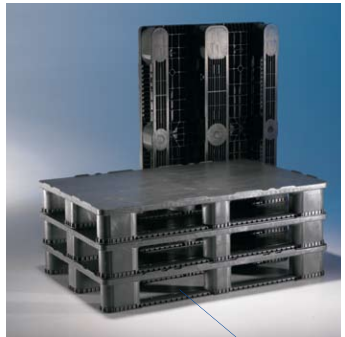
De vrije ruimte (hoogte en lengte) tussen de klossen maakt deze pallet bijzonder gebruiksvriendelijk en uniek in zijn soort.